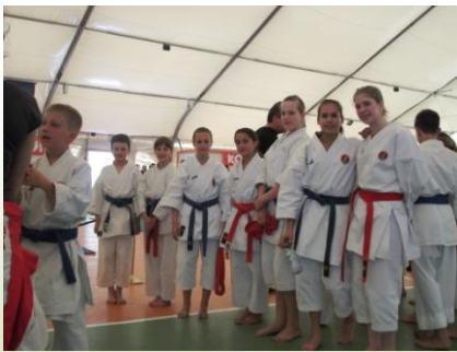
Uspješna lošinjaska ekipa

Ovom prilikom zahvaljujemo se obitelji Bani koji su natjecatelje odvezli na turnir u Opatiju, i koji su bodrili naše natjecatelje.