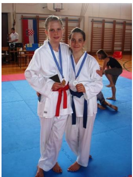
Prve medalje u borbama: